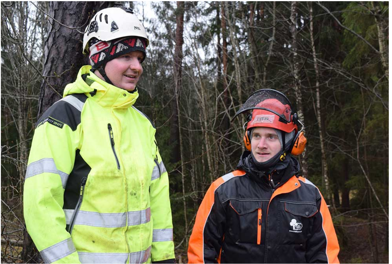
Instruktörer till trädräddningskursen [11/11]